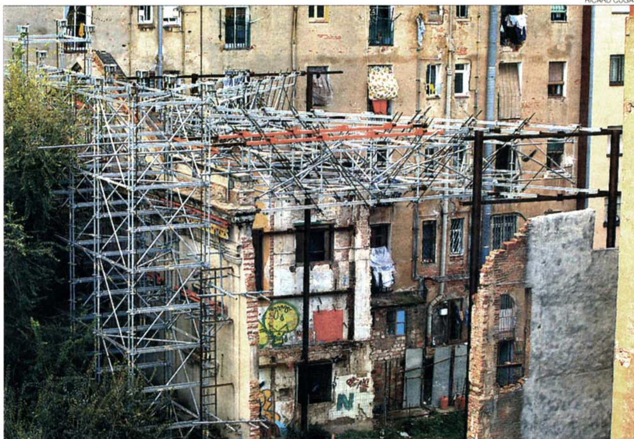
►► El cine Colón, en estado ruinoso, con la fachada apuntalada, el pasado jueves.

El segundo renueva el sistema tradicional de hospedaje. Claramunt ha diseñado una gran estantería metálica que se incrustará en el edificio. Y en su interior, como si fueran cajones, estarán las habitaciones, prefabricadas y ensambladas fuera y dotadas con instalaciones muy básicas. «Cuando se viaja, lo que se quiere es cama y ducha y que todo funcione perfectamente», señala el arquitecto. Claramunt añade que cuando funcione el hotel, al que presumiblemente acudirá gente joven,