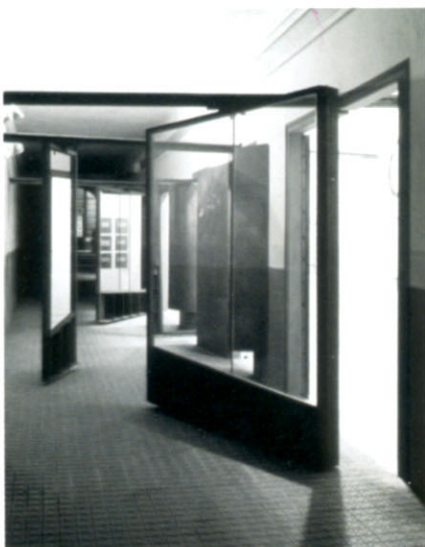
A la izquierda, imagen del diseño de la Galería Passatge. A la derecha, Casa Muntaner.