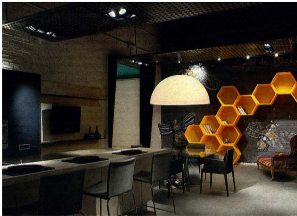
'Loft' creado por Xavier Cruz, con estanterías en forma de panal. Los muebles son de diferentes épocas y materiales.

bles, económicos y muy prácticos, pensados para jóvenes con pocos recursos que viven en grandes ciudades. Los tres modelos expuestos están totalmente equipados, hasta el más mínimo detalle.