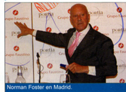
Norman Foster en Madrid.

Norman Foster ha presentado en Madrid la nueva bodega que diseña para la empresa vinícola Grupo Faustino en la DO Ribera de Duero, bautizada Bodegas Portia . El proyecto, que cuenta con una